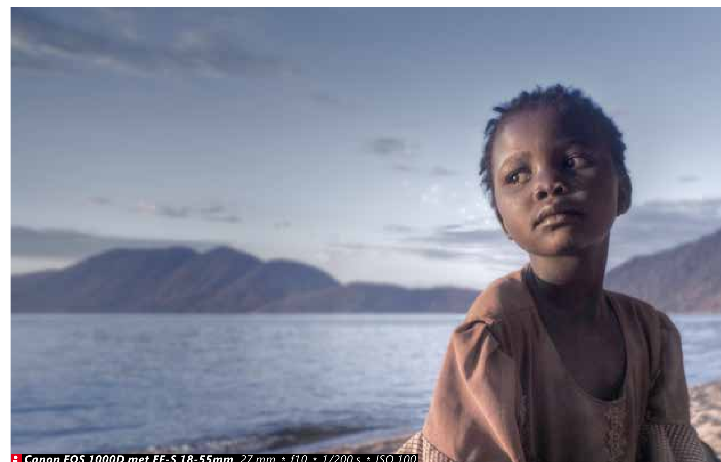
Canon EOS 1000D met EF-S 18-55mm 27 mm * f10 * 1/200 s * ISO 100

▶ A thousand words Lake Malawi - “Dit meisje lijkt in haar jonge koppie al veel meegemaakt te hebben. Deze dromerige blik heb ik daarom vastgelegd. Zelden heb ik zo’n diepe blik bij een kind gezien.”