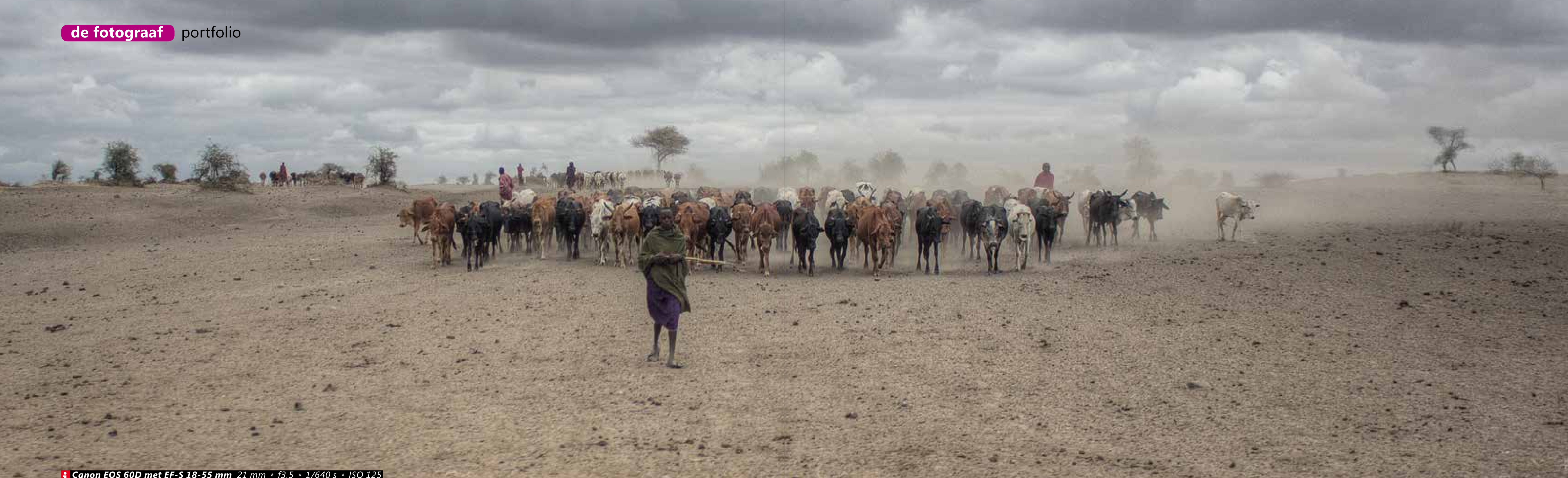
Canon EOS 60D met EF-S 18-55 mm 21 mm * f3,5 * 1/640 s * ISO 125