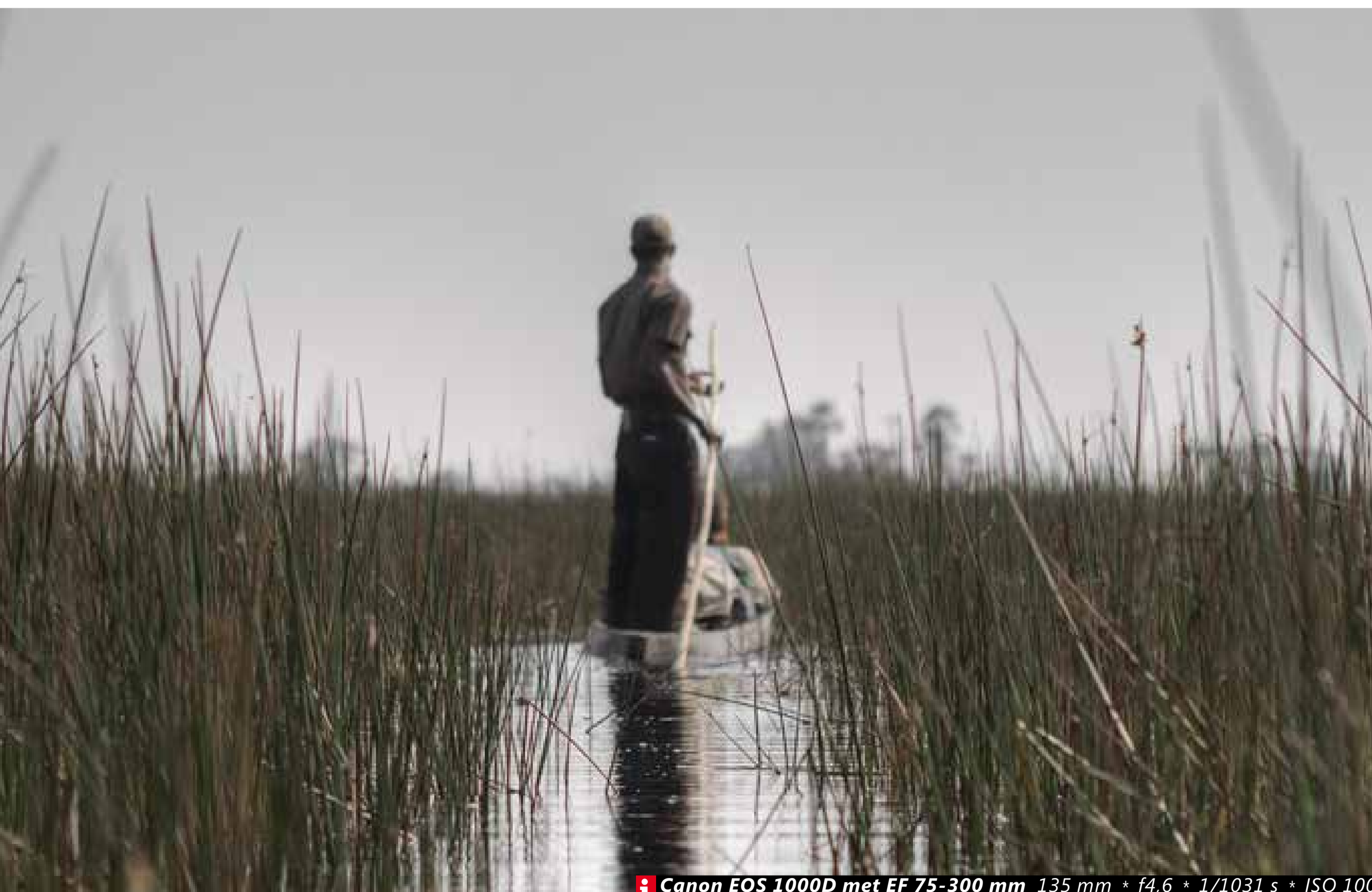
Canon EOS 1000D met EF 75-300 mm 135 mm * f4,6 * 1/1031 s * ISO 100