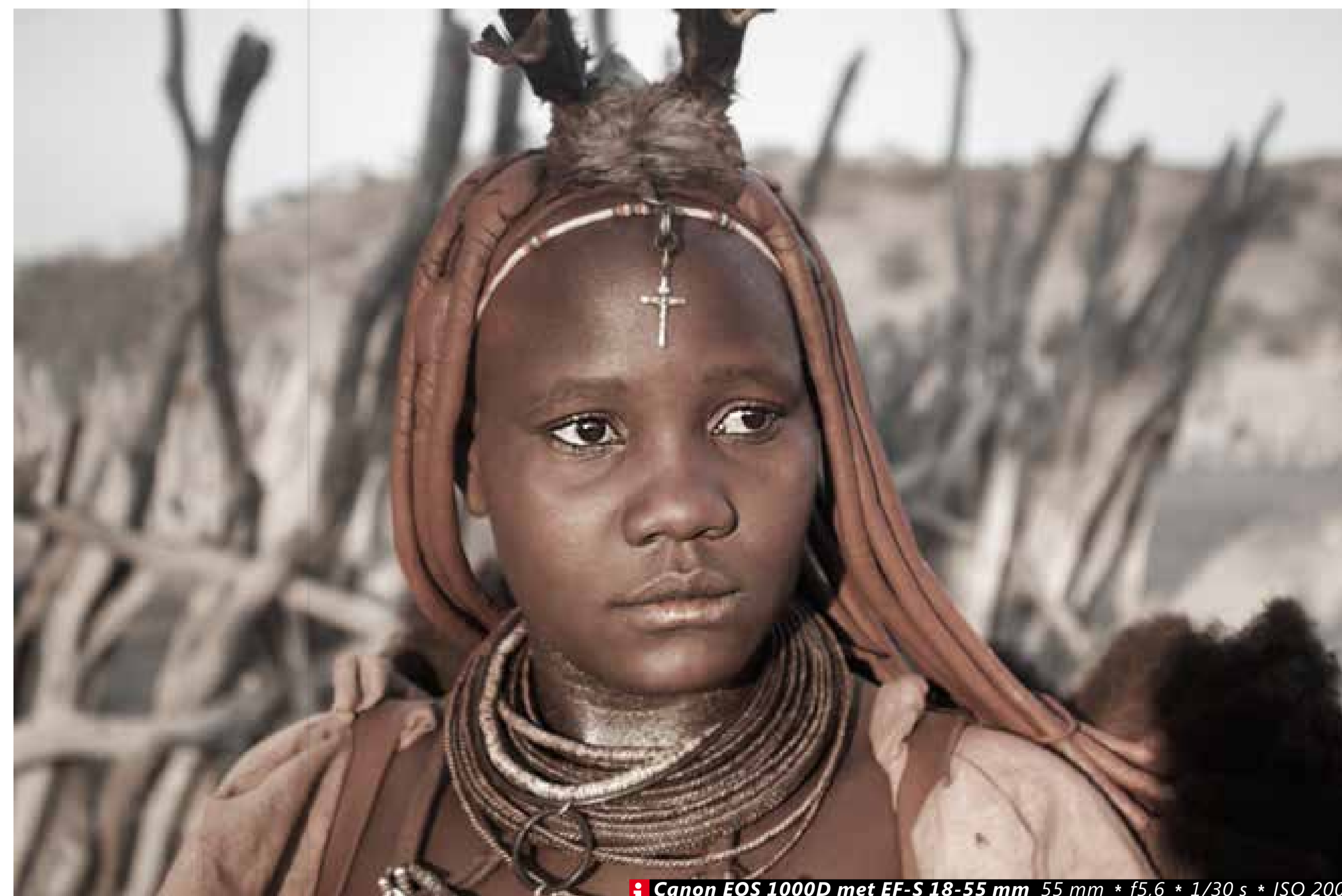
Canon EOS 1000D met EF-S 18-55 mm 55 mm * f5,6 * 1/30 s * ISO 200

▲ Masai herd "Yes!" was wat ik riep na het schieten van deze plaat. We reden met 120 km/u over een weg en ik zag in de verte stof opstuiven. Ik heb direct mijn raam opgedraaid en mijn camera zo goed mogelijk ingesteld. Tijdens het passeren heb ik twee keer kunnen klikken."